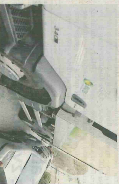
Źle zaparkowane samochody utrudniają przejazd śmieciarkom.

Nieprawidłowo zaparkowane samochody przy altanach śmietnikowych to spory problem dla pracowników firm wywozowych odbierających odpady – szczególnie z budynków wielorodzinnych. Często zdarza się, że mieszkańcy zastawiają samochodami dojazd do pojemników i altan nawet pomimo ustawionych zakazów parkowania. Pracownicy firm wywozowych muszą w takiej sytuacji sami przyciągnąć ciężkie pojemniki z odpadami, do znacznie oddalonej śmieciarki. Błędem