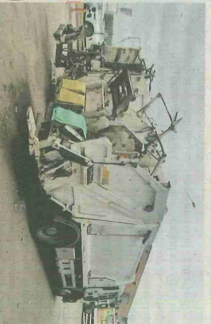
Śmieciarka dwukomorowa, dzięki dwóm osobnym komórkom ma możliwość odbierania np. tworzyw sztucznych z metalami i szkła

Tak więc fakt, że różne typy odpadów zabierane są jednocześnie i wwożone w jednym samochodzie nie oznacza, że odpady zostają ponownie zmieszane i nie są poddawane recyklingowi. Oznacza to jedynie, że samochody, którymi odbierane są odpady, są specjalnie