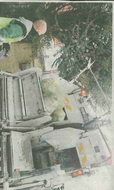
Śmieciarka dwukomorowa może odebrać jednocześnie dwa różne rodzaje odpadów

Widok śmieciarki, do której pracownik wrzuca odpady z różnych pojemników, zniechęca mieszkańców do sortowania odpadów w domu. Nieśluszenie. Samochód – śmieciarka wbrew pozorom to nie jest proste urządzenie. Często to wielofunkcyjne samochody z dwiema, a nawet czterema komorami, które jednocześnie mogą zabrać kilka rodzajów odpadów, np. szkło, plastik, papier, czy odpady zielone. Samochód specjalistyczny, typu „śmieciarka” odbierająca np. dwa typy odpadów z całą pewnością jest wyposażony w dwie komory, co oznacza, że każda z frakcji wrzucana jest do odrębnej zamkniętej przestroni. Tym samym – odpady zbierane w ten sposób nie mieszają się wewnątrz. Master – Odpady i Energia Sp. z o.o. stale unowocześnia swoją flotę czego przykładem może być zakup dwóch specjalistycznych samochodów posiadających możliwość odbioru dwóch frakcji odpadów jednocześnie, dzięki dwóm osobnym komorom – ma możliwość odbierania np. tworzyw sztucznych z metalami i szkła, a także odpadów bio-zielonych oraz odpadów bio-kuchoennych. I tak, np. śmieciarka wyposażona w dwie komory tego samego dnia, jednocześnie może odebrać z nieruchomości szkło (zielony pojemnik/worek) oraz tworzywa sztuczne z metalami (żółty pojemnik/worek).