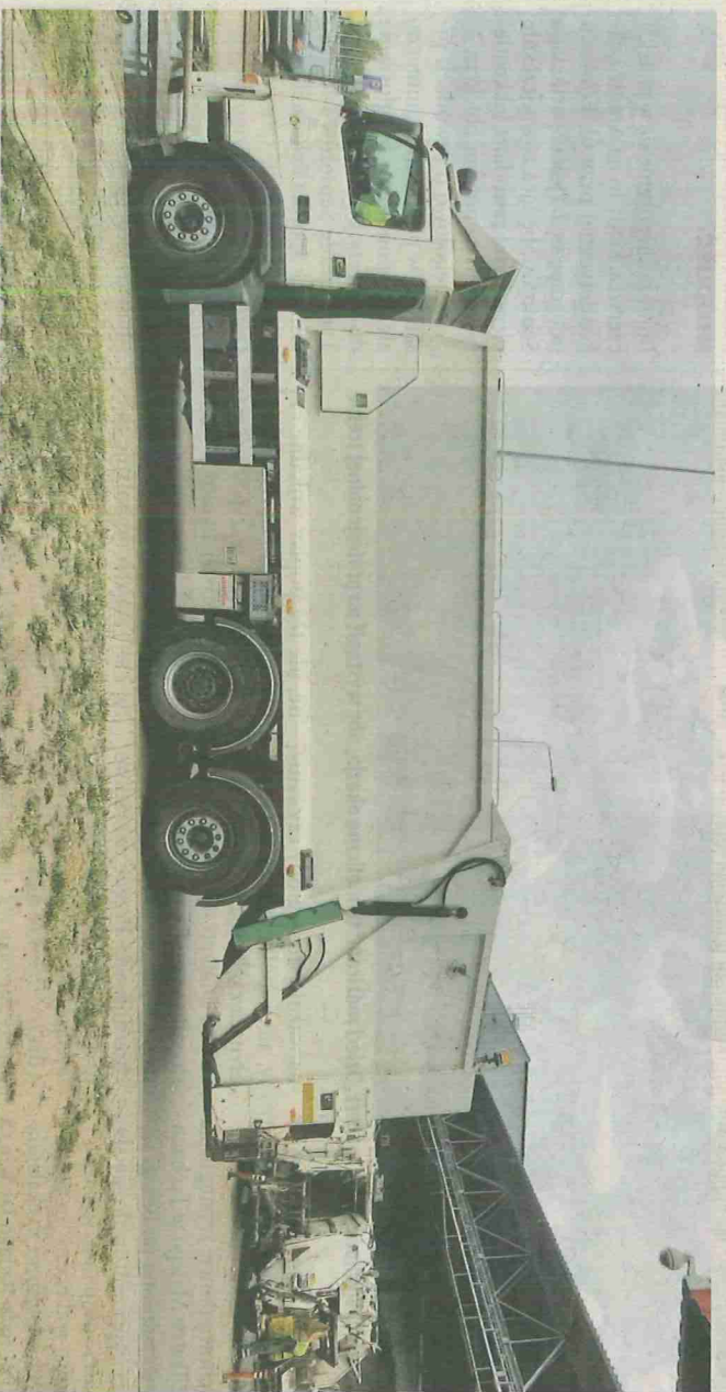
Śmieciarki dwukomorowe gotowe do wyjazdu z bazy Master – Odpady i Energia Sp. z o.o.

przygotowane do odbioru różnych frakcji i posiadają komory, dzięki którym odpady transportowane są zgodnie z wymogami nowoczesnego zakładu odzysku odpadów.