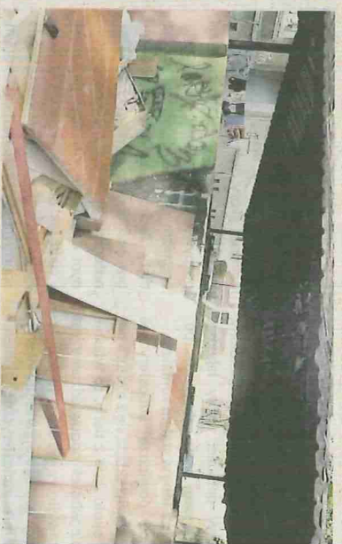
Te odpady powinniśmy dostarczyć do PSZOK.

popelnianym także przez wielu mieszkańców jest pozostawianie pozostawłości po remoncie pod altaną śmietnikową - w miejscu, gdzie powinni czekać na odbiór odpady wielkogabarytowe. Tymczasem odpady remontowo-budowlane pozostawione przy altan śmietnikowych lub przy domach jednorodzinnych w ramach tzw. „wystawki”, nie są zabierane przez firmę wywozującą odpady. Co więcej, za pozostawienie ich w niedozwolonych miejscach można dostać mandat. Odpady remontowe – budowlane powinny zostać dostarczone do Punktu Selektywnego Zbierania Odpadów Komunalnych tzw. PSZOK (ul. Katowicka i Serdeczna w Tychach)